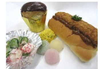
月替わりランチBOX 600円