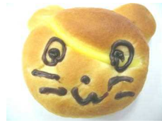
キャラクターパン 184円 (クリーム入り)