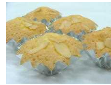
プチマドレーヌ 378円 (5個入り)