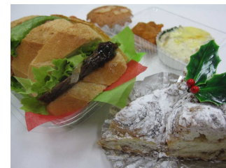
月替わりランチBOX 600円