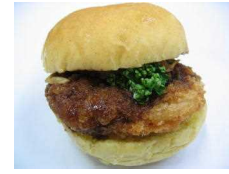
チキンカツカレー 238円