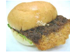
ハムフライバーガー 194円