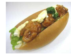
チキン南蛮ドッグ 238円