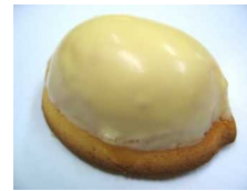
レモンケーキ 173円 (10月~4月限定)