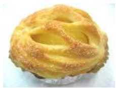
アップルデニッシュ 205円