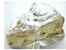
すっごくおいしいリンゴパン 205円