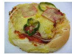
ピザパン (土日限) 216円