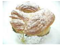
メープルキャッスル 173円