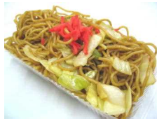
焼きそばパック 238円