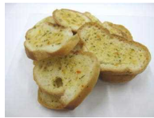
ガーリックラスク 216円