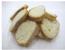
シュガーラスク 216円