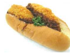
牛肉コロッケサンド 238円