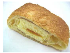
カステラデニッシュ 173円