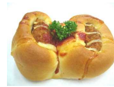
フラワーコロッケ 173円