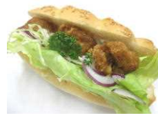
若鶏の竜田サンド 238円