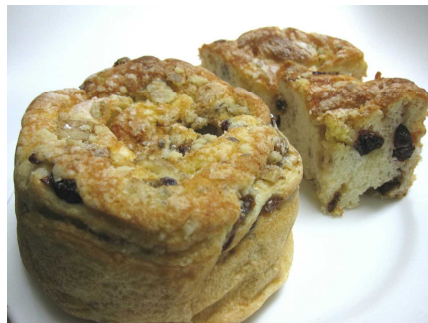
和胡桃のフルーツteaブレッド 702円