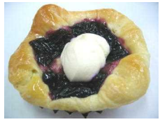
ブルーベリーヨーグルト 184円