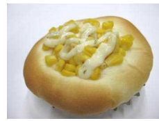
スイートコーン 173円