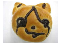
キャラクターパン 184円 (クリーム入り)