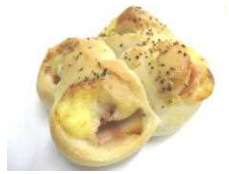
C C B 173円