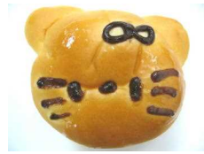
キャラクターパン 184円 (クリーム入り)