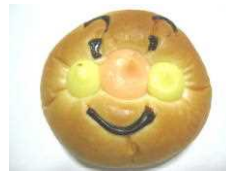
キャラクターパン 184円 (クリーム入り)