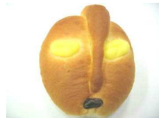
キャラクターパン 184円 (クリーム入り)