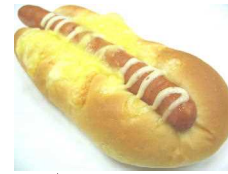
チョコ辛ウイナー 184円