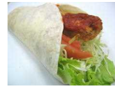
トルティーヤ 292円 (チリソーセージ)