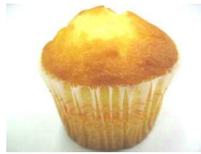
ケーキマフィン 162円