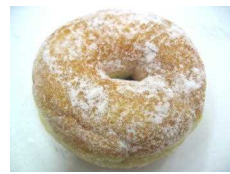
イーストーナツ 140円