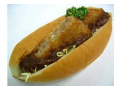
デミグラメンチカツ 205円