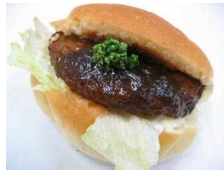
てりやきロール 173円