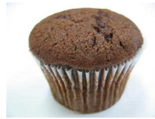
チョコマフィン 162円