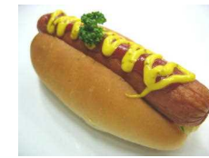
ジャンボソーセージ 270円