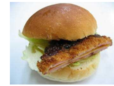
ハムチーズバーガー 216円