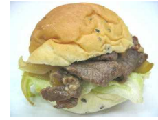
セサミ焼き肉バーガー 194円