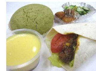
月替わりランチBOX 600円