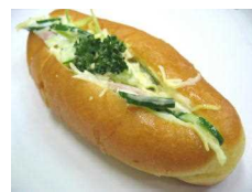
サラダドッグ (土日限) 205円