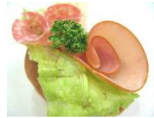
ローズハムロール 173円