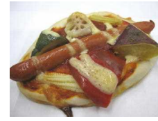
ゴロゴロ野菜のソーセージピザ 216円